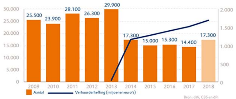
Verhuurderheffing en nieuwbouwproductie 2009 - 2018

→ De initiatiefnemer stelt voor om de verhuurderheffing te verlagen voor verhuurders die investeren in renovatie, verduurzaming en woningbouw.